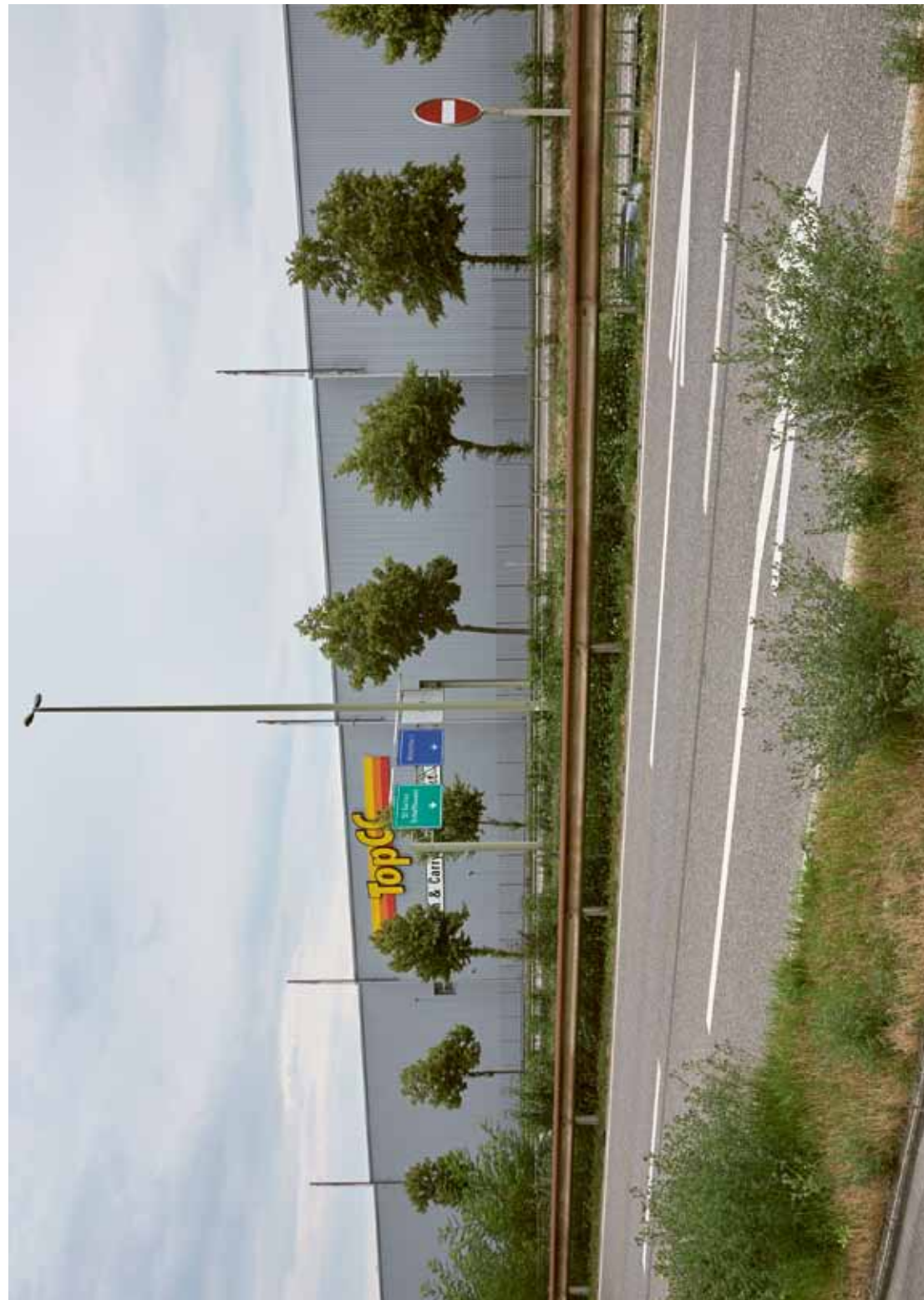
FORUM ARCHITEKTUR WINTERTHUR — 8400 WINTERTHUR WWW.FORUM-ARCHITEKTUR.CH

In Veranstaltungen zu den Themen Treffpunkt, Lärm und Geschwindigkeit möchten wir Vorteile und Potenziale der Räume zwischen den Häusern entdecken und aufzeigen, dass diese «mehr als Strasse» sein können.